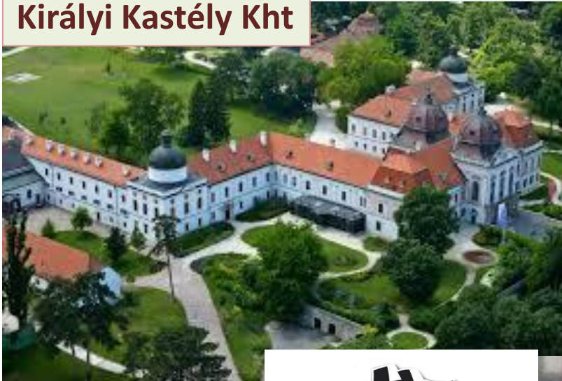
Gödöllő Királyi Kastély Kht